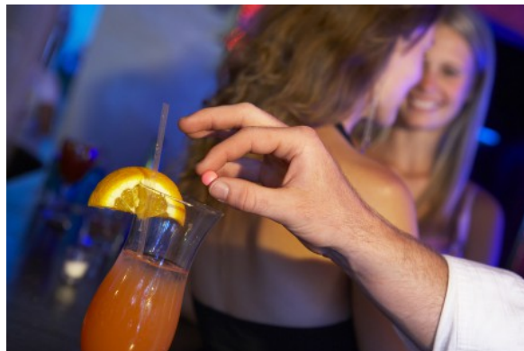
Zo drogeerde Jaap de Vaginajager zijn minderjarige meisjes, meestal in vooraf geprepareerd blikje cola. Veel tijdens maagden-plukken in Frankrijk!