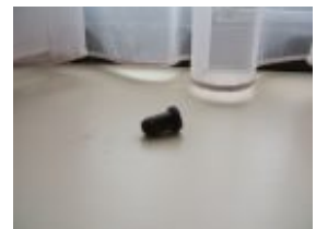
Het plastic lager wat ik op de grond onder het bed vond en wat men zo snel niet meer kon vinden natuurlijk!