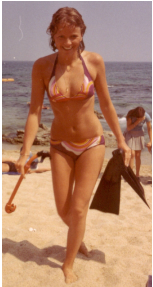
Foto van mijn prachtig mooie vriendin waar ik dodelijk smoor verliefd op was, Costa Brava juli 1972 die in bars in Utrecht in boekjes te zien was voor seks. Ze kreeg dagelijks speciale drug toegediend. Stond bij dat haar vriend van niets wist! Ze stonden in de rij!