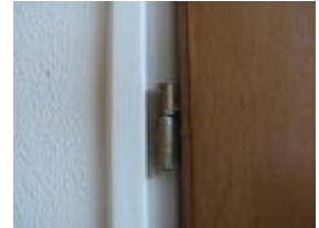
Scharnier zonder het lager, dus deur was er uit geweest en plastic lager op de grond gevallen!